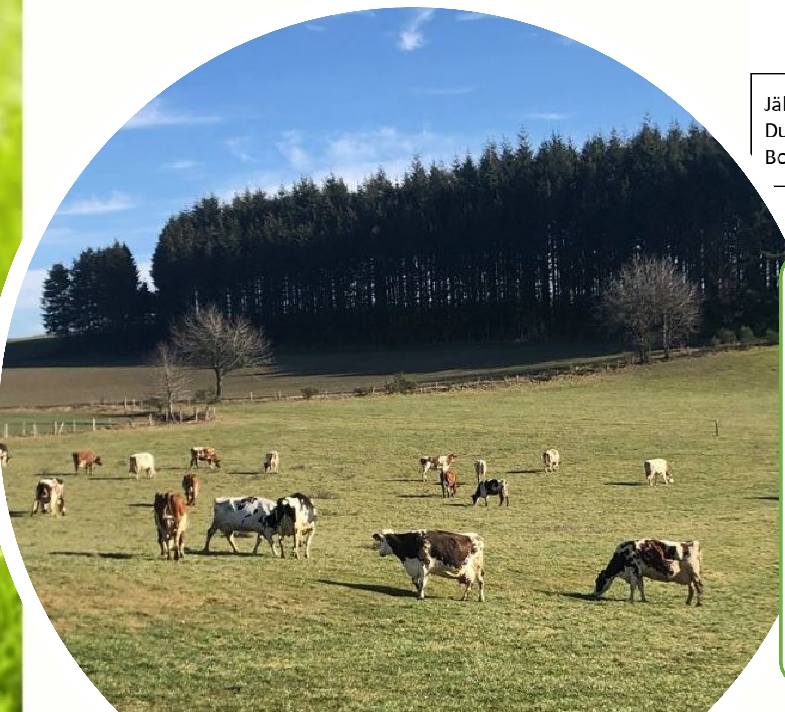
Abb.: Frühe Weide auf einem Pilotbetrieb im Norden des Landes

Von 5 Pilotbetrieben werden repräsentative Daten für die verschiedenen Grünlandregionen Luxemburgs zur Verfügung gestellt. Ziel ist es anhand der wöchentlich ermittelten Daten den Graszuwachs für die kommende Woche zu prognostizieren.